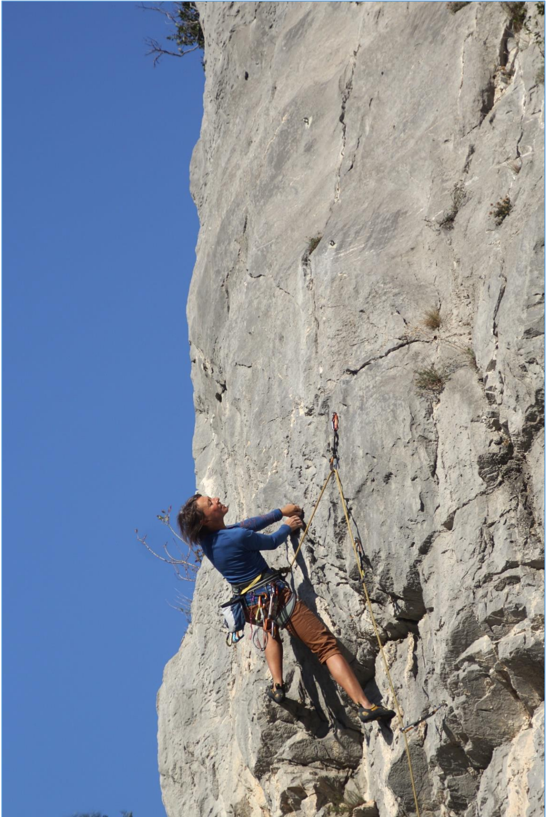
Zot sulla “Variante Warz”.