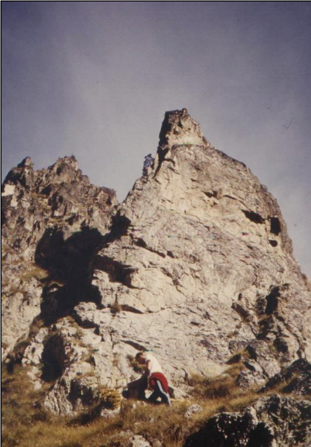
All'attacco delle via.