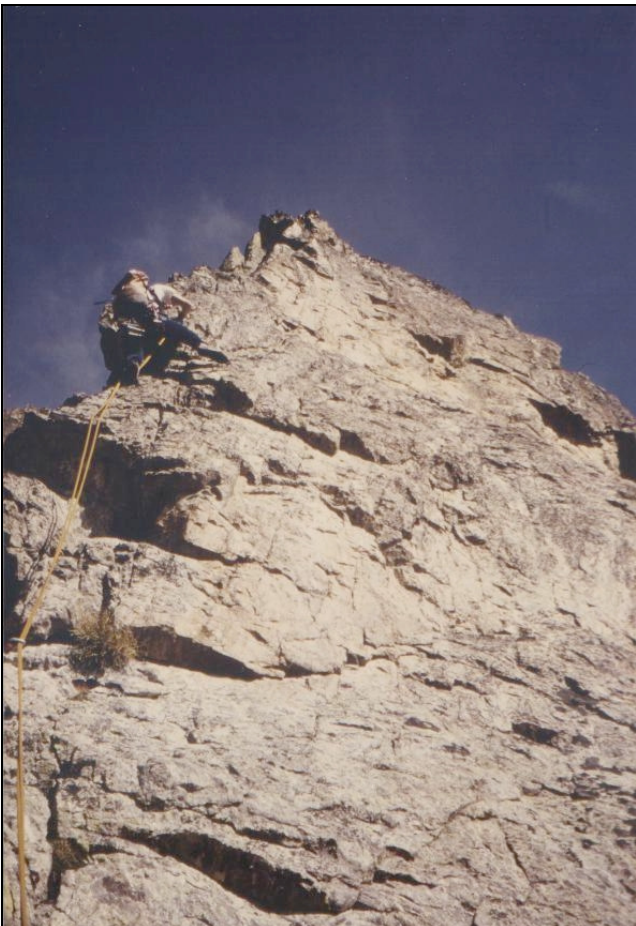
Sul primo tiro.